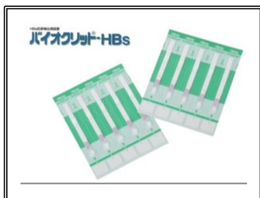
B型肝炎ウイルス検査キット